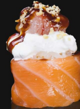
Gambero rosso stracciatella Bigné di riso avvolto da salmone e ricoperto da stracciatella di burrata e gambero rosso in salsa teriyaki e pistacchio

1pz - 4,00 euro Allergeni: 1, 3, 4, 8, 9