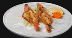
Gamberoni alla griglia Gamberoni alla piastra con salsa teriyaki e sesamo