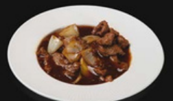
Manzo cipolla con pepe nero Manzo saltati con cipolla e salsa di pepe nero