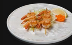
Spiedini di gamberi Spiedini di gamberi cotti alla piastra con salsa teriyaki e se samo