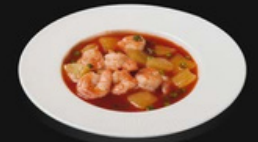
Gamberi agrodolce Alette di pollo fritti