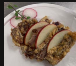
Anatra frita Anatra arrosto