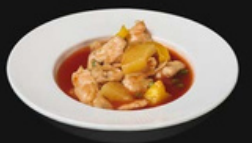
Pollo agrodolce Bocconcini di pollo con salsa agrodolce e ananas