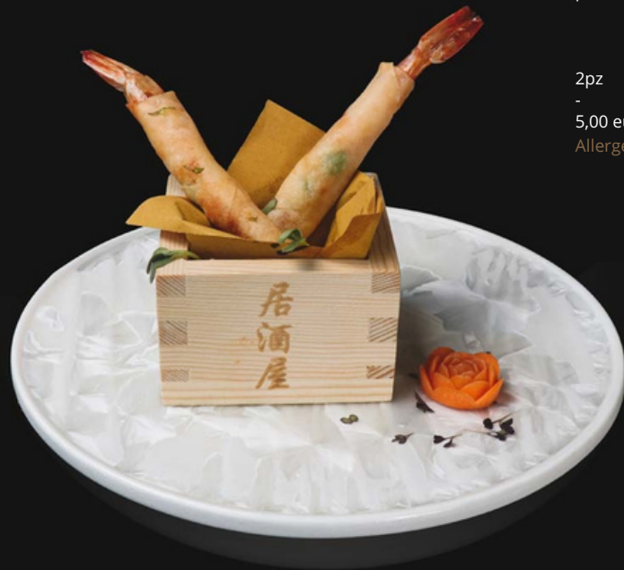
Involtini di gamberi Involantino fritto con gambero e piselli