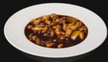
Kon pao pollo Pollo saltato in padella con carote e bambu e salsa piccante