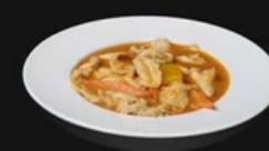
Pollo Thai Bocconcini di pollo saltato con curry rosso, carote, cipolla, peperoni leggermente piccante