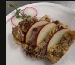
Anatra frita Anatra arrosto