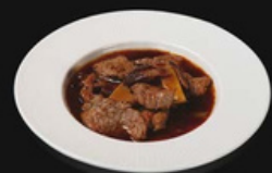
Manzo funghi e bambu Fettine di manzo saltato in padella con salsa funghi e bambu