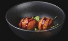
Takoyaki Tocchetto di polpo avvolto in sfoglia croccante frita