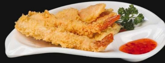
Tempura mista Verdure e gamberi fritti in tempura

Poco piccante 3pz - 6,00 euro Allergeni: 1