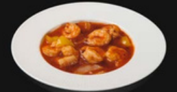
Gamberi piccante Gamberi saltati con cipolla e peperoni e salsa piccanti