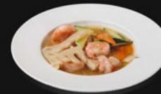
Gamberi con verdure miste Gamberi saltati in padella con zucchine, carote e bambu