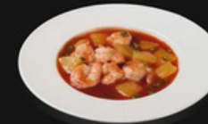
Gamberi agrodolce Alette di pollo fritti