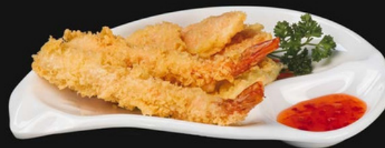
Tempura mista Verdure e gamberi fritti in tempura

Poco piccante 3pz - 6,00 euro Allergeni: 1