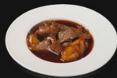
Manzo patate Manzo saltati con patate