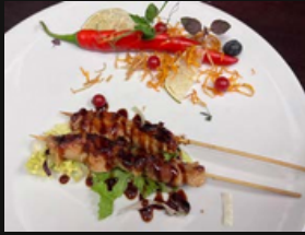
Spiedini di pollo Spiedini di pollo alla piastra con salsa teriyaki e sesamo