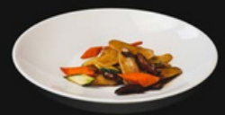
Gnocchi di riso con gamberi Gnocchi di riso salati in padella con verdure e gamberi