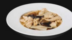
Pollo funghi e bambu Fettine di pollo saltato in padella con salsa funghi e bambu